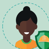
Un défenseur syndical