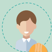
un salarié ou un employeur appartenant à la même branche d'activité