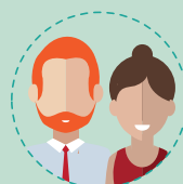
leur conjoint, partenaire de PACS ou concubin