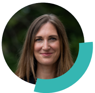
Carole Grandjean , ministre déléguée chargée de l'Enseignement et de la Formation professionnels

La période de fin d'année scolaire approche, les questions sur l'orientation sont multiples pour les jeunes qui envisagent de poursuivre leurs études en septembre. Nous nous réjouissons de voir que l'intérêt pour l'apprentissage ne cesse de grandir : plus de 830 000 jeunes ont signé un contrat en 2022, soit une augmentation de 14 % par rapport à 2021.