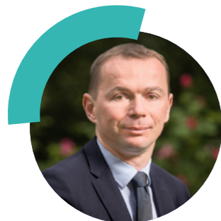
Olivier Dusopt , ministre du Travail, du Plein emploi et de l'Insertion